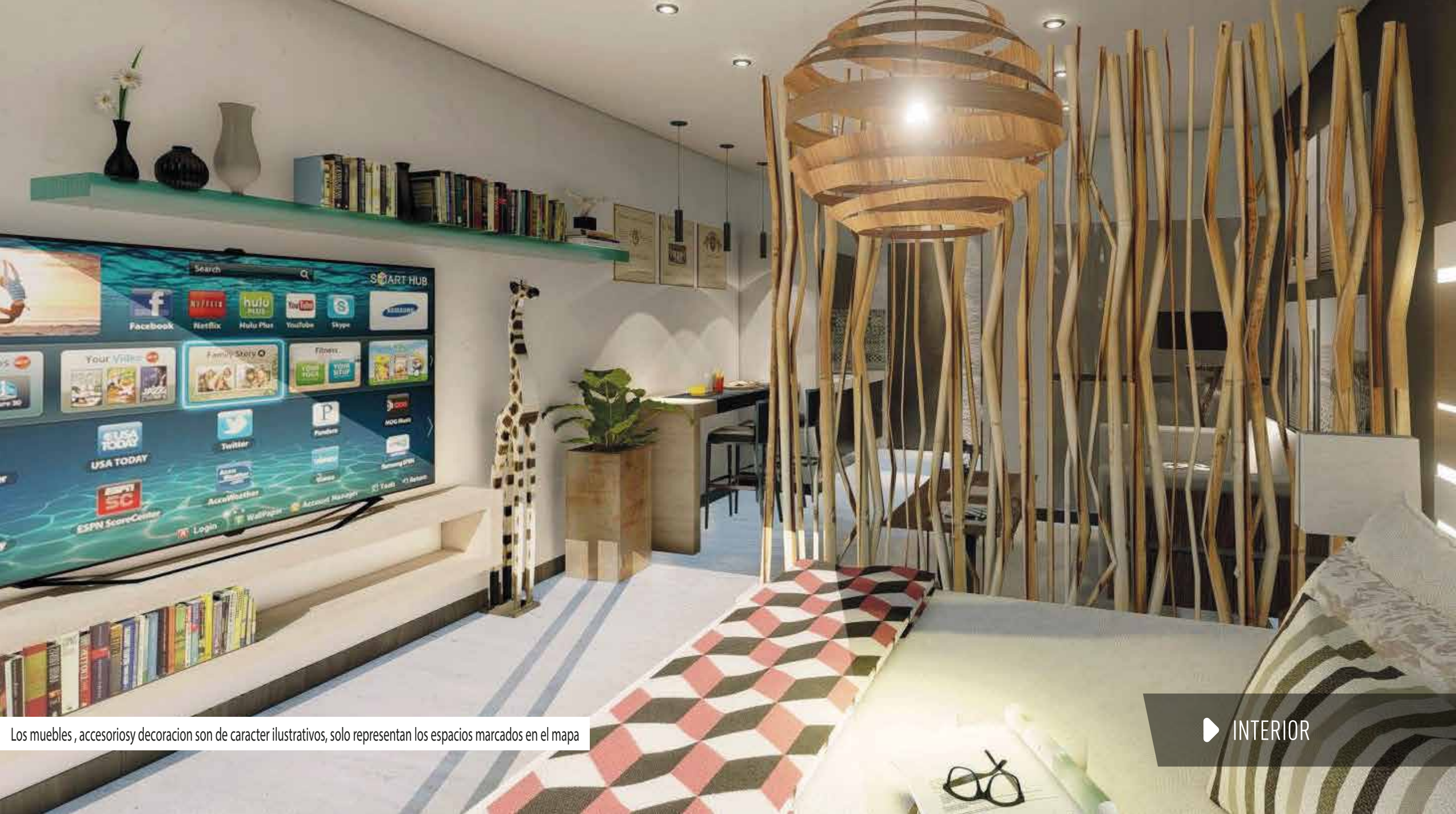
Los muebles, accesorios y decoración son de carácter ilustrativos, solo representan los espacios marcados en el mapa